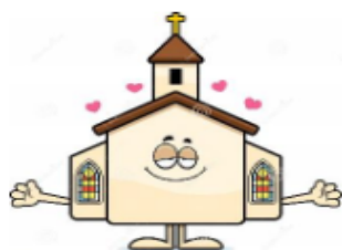
Conseil de fabrique de Salmbach

www.fraternitepentecote.fr - Pour nous contacter : fratpental@gmail.com / tél. 07 52 02 70 10 Diocèse de Strasbourg / Communautés et groupes de prière du RC